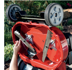
Dual-Force (2 cuchillas) Atomic de Toro®